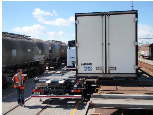
Containerumschlag mittels der Grob-Schubkette

Denn der Güterverkehr auf der Schiene bietet viele Vorteile: Sicherheit, Schutz des Klimas, Planbarkeit und Zuverlässigkeit. Doch was ist, wenn die Ware am Endbahnhof angekommen ist? Wie kommt der Container von der Schiene auf die Straße? Und wie verkürzt man die Umlaufzeiten auf ein Minimum und behält die Handlingskosten im Griff?