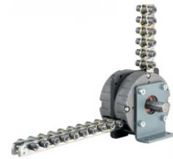
Die Grob-Schubkette in Aktion

In der Schweiz ist solch ein innovatives Verladekonzept mit integrierten Schubketten schon seit 2011 sehr erfolgreich im Einsatz. Beispielsweise nutzt die Bahnlogistiktochter des Schweizer Lebensmittelgroßhändlers Coop, railCare, den ContainerMover-3000 schon seit 2011 mit wachsendem Erfolg und es ist nur eine Frage der Zeit, bis auch die angrenzenden Nachbarstaaten wie Deutschland, Frankreich oder Italien sich dieser wegweisenden Technologie öffnen werden.